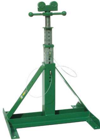
Cavalletto Reel Mac 70