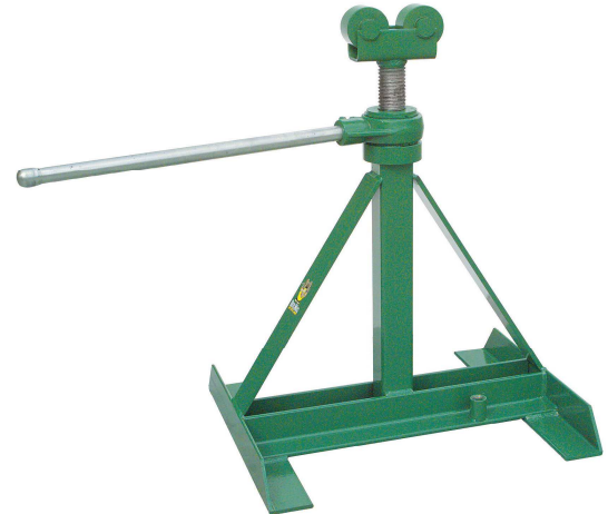
Cavalletto Reel Mac 80

Cavalletto per il sostegno delle bobine fino a \varnothing 2.285 mm (90"). Leva a cricchetto rimovibile, per il sollevamento rapido delle bobine. Da usare con l' asta di sostegno n° 81.