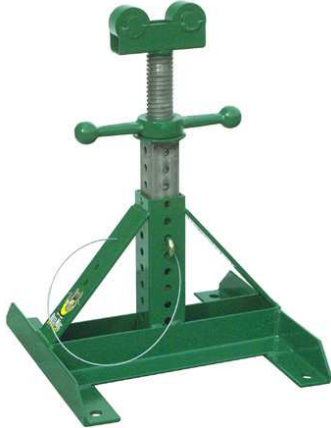
Cavalletto Reel Mac 60