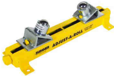
Table Adjust A Roll