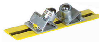
sfere in acciaio - in acciaio inox