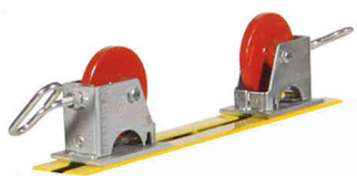
ruote in acciaio - in acciaio inox

Pro Roll - Hi Adjust A Roll - Lo Adjust A Roll - Table Adjust A Roll - Mini Roll